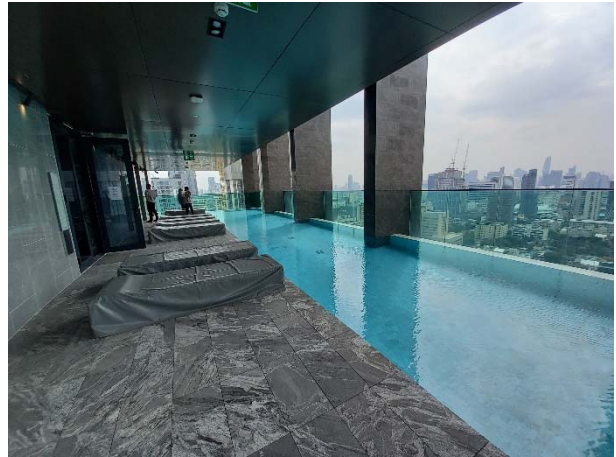
ภาพที่ 1.3-2 สภาพปัจจุบันของโครงการ (ต่อ)